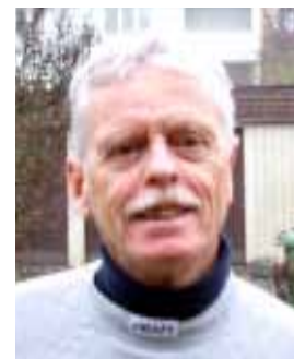
Den skräddade rapportören